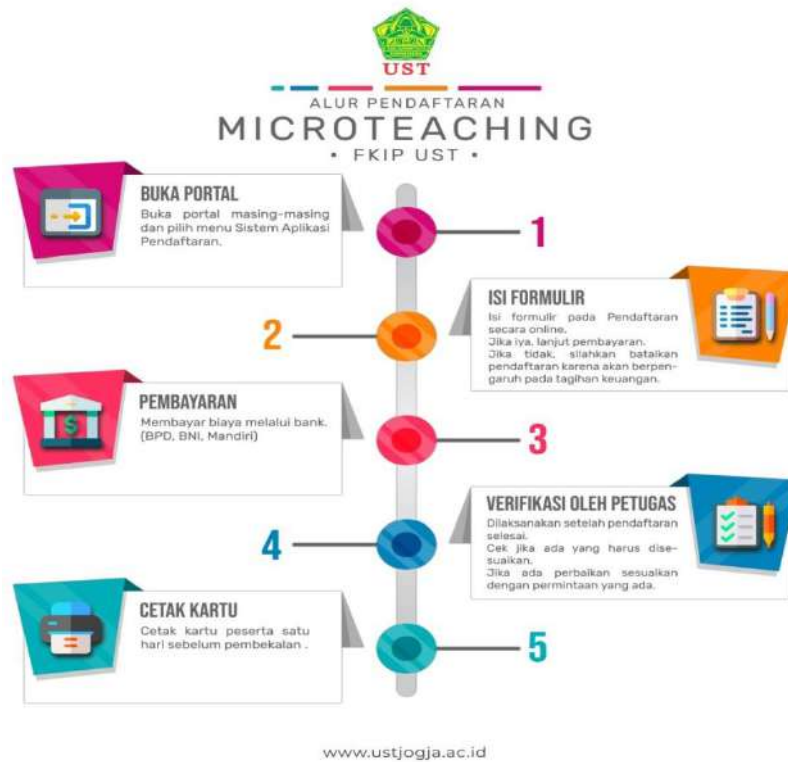
Gambar 1. Alur Pendaftaran