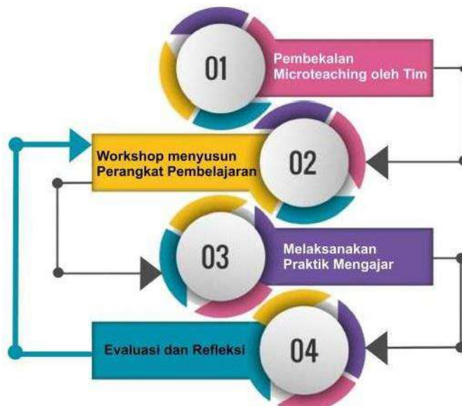
Bagan 2. Mekanisme Pelaksanaan Micro Teaching