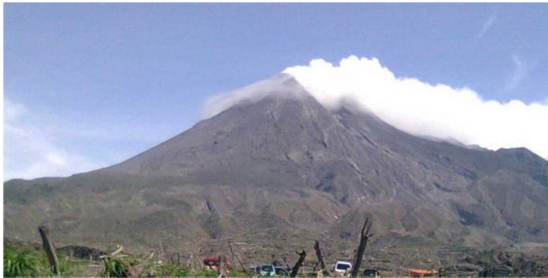
Gambar 3.2 Gunung Berapi